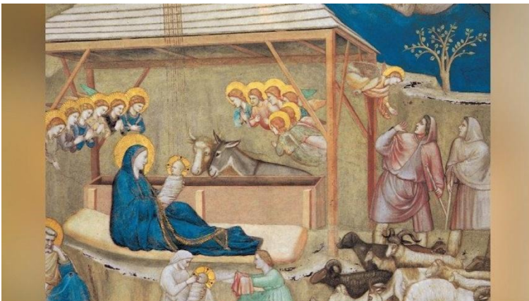
Affresco "Natività" di Giotto nella Basilica di Assisi

Nel Medio Evo ( anno 1000...1200) , periodo in cui sorgono molti castelli e monasteri, il colore blu, ottenuto in parte dal lapislazzulo , ma soprattutto l'azzurrite ottenuta dalla malachite, viene destinato alla venerazione della Madonna : lo troviamo in affreschi, mosaici, dipinti a Lei dedicati. Giotto nei primi anni del 1300 dipinse un bellissimo cielo stellato nella bellissima Cappella degli Scrovegni a Padova ; altre sue importanti pitture sono nella Basilica di Assisi .