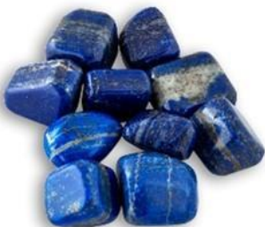
pietre naturali di lapislazzulo.

Il lapislazzulo è una pietra che si ricava dalle montagne dell'Afghanistan, in Asia, difficile da estrarre, e nei tempi antichi, difficile da ottenere proprio perché le comunicazioni e gli scambi non erano facili ( non esistevano auto o aerei, e l'estrazione era a mano picchiando con il martelletto nelle miniere); per questo anche molto costosa.