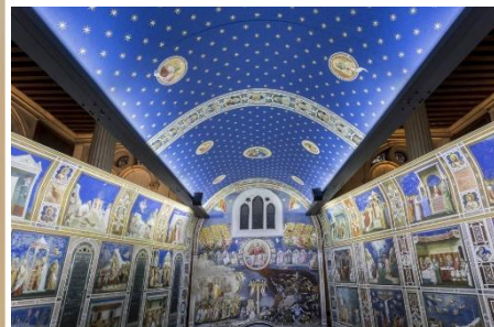
Cappella degli Scrovegni a Padova

Piano piano , successivamente al secolo XII, la moda del colore blu si diffuse in Europa, grazie anche alla scoperta di nuove fonti da cui ricavare il colore blu: una pianta chiamata guado .