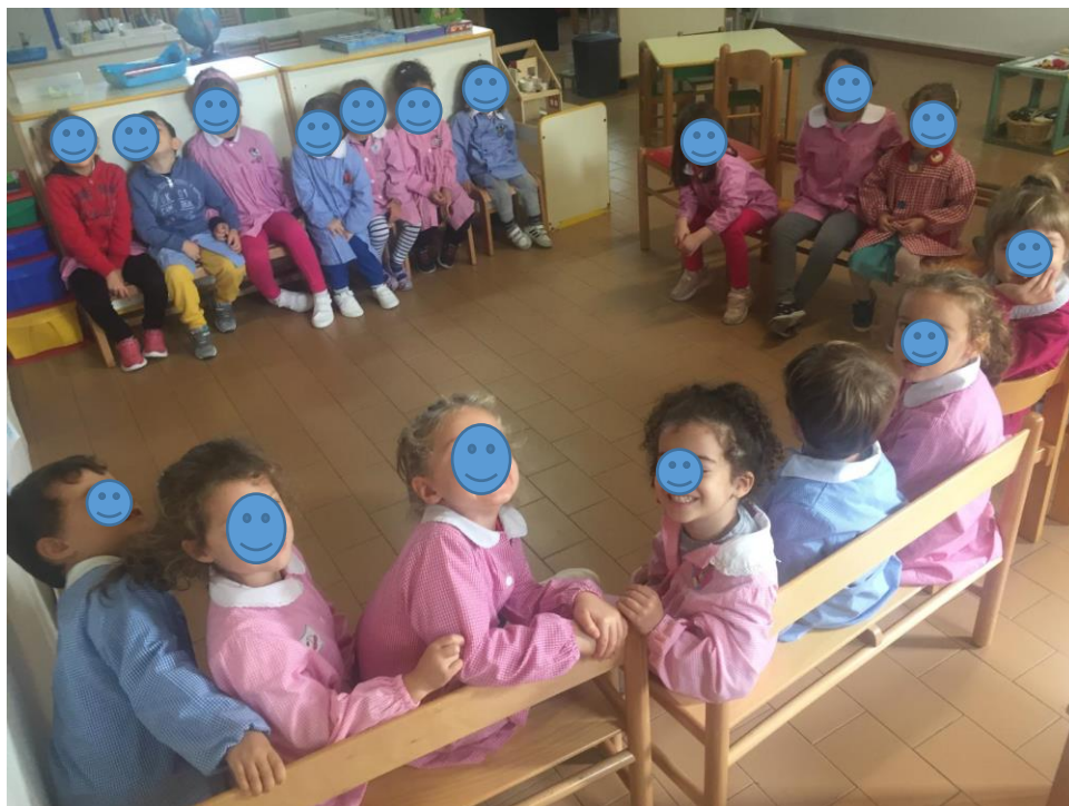
CONVERSAZIONE IN CIRCLE TIME