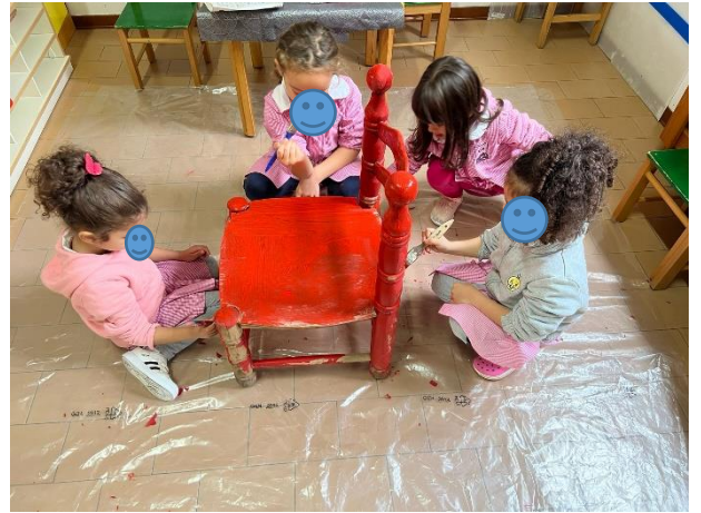
ARTISTI AL LAVORO